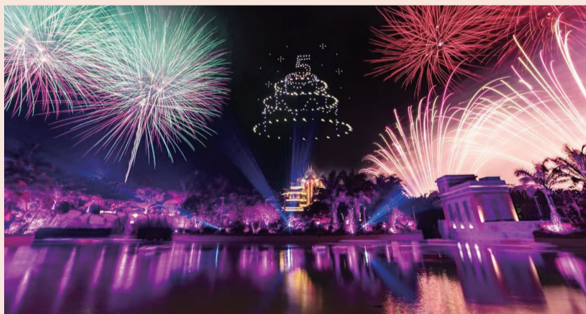
三亚·亚特兰蒂斯“水世界粉色之夜”用粉色烟花将整个水世界揉入梦境

“亚特兰蒂斯水世界粉色之夜”用粉色烟花将整个水世界揉入梦境，现场乐队、舞蹈传递热带风情；失落的空间水族馆布满水下盲盒；“快跑鸭和它的朋友们”与宾客嬉戏漂流河。2020年起，“亚特兰蒂斯水世界夜场嘉年华”全面升级。2022年7月至8月，“2022亚特兰蒂斯超级暑假”加入升级版C秀、美人鱼潜水体验。2023年1月16日首次开启冬季夜场“亚特兰蒂斯水世界粉色之夜”，在园区多个舞台轮番演绎粉色主旋律的巨型雕塑和动物造型灯饰、集市。2021、2022年10月万圣节，失落的空间水族馆启