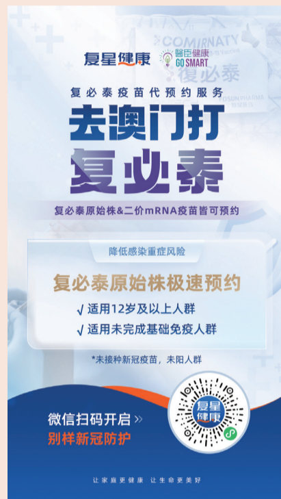
扫码预约赴澳门接种复必泰二价 mRNA 疫苗

变异株成分的新冠二价mRNA疫苗替代之前获批的疫苗做加强接种；钟南山院士强调，用异种疫苗加强免疫（两剂灭活疫苗基础上，加用mRNA疫苗等异种疫苗），效果明显提高。研究表明，复必泰二价疫苗是已上市复必泰BNT162b2的迭代和补充，针对BQ.1.1和XBB.1的中和抗体滴度可分别提高8.7倍和4.8倍，可有效应对奥密克戎变异株，对老年人或有基础病的相关人群有较高的安全性及有效性。