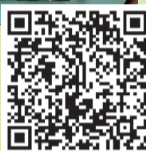
扫码看上海表的组装