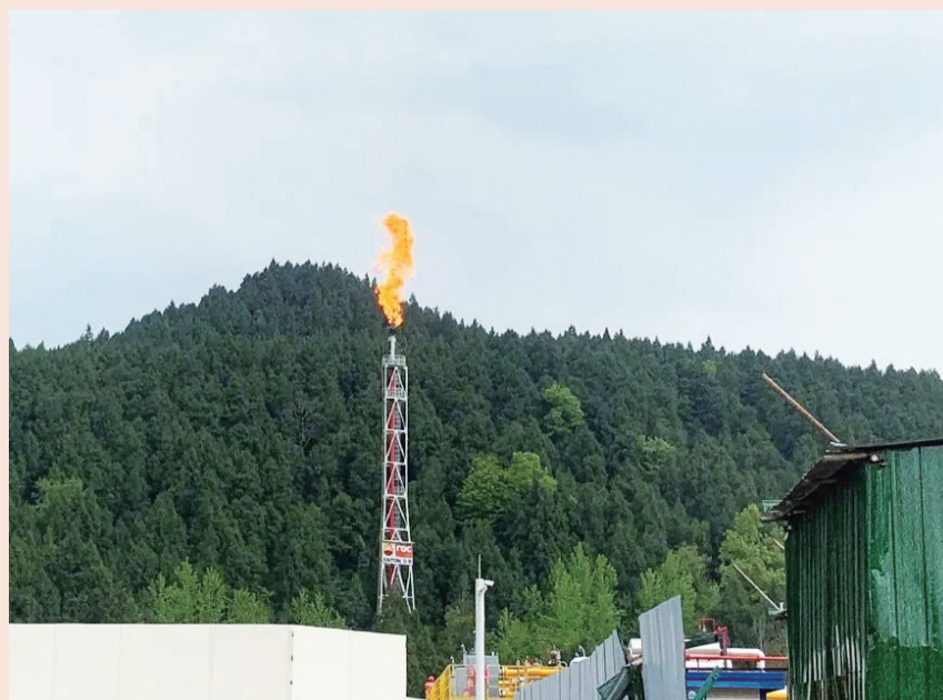
海南矿业积极拓展新能源领域

投资并购方面，洛克石油49%股权收购已完成澳大利亚外国投资审批委员会（FIRB）审批手续；涉及马里锂矿产的