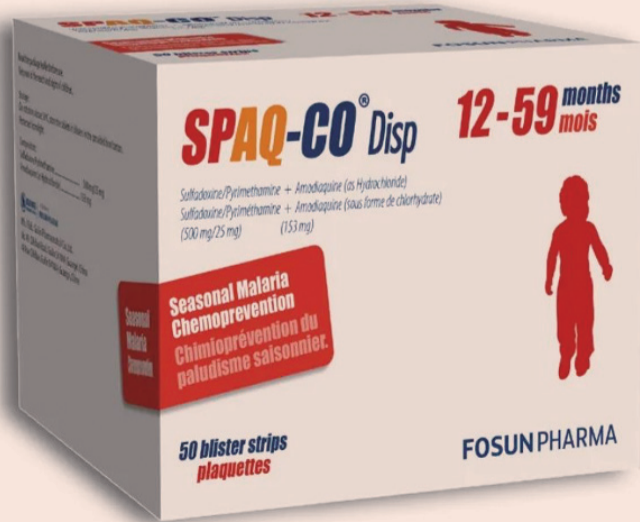
复星医药研发生产的儿童疟疾预防用药 SPAQ-CO® Disp（磺胺多辛乙胺嘧啶分散片/阿莫地喹分散片组合包装）

复星医药首席执行官文德镛表示：“复星医药作为一家植根中国、创新驱动的全球化医药健康产业集团，始终将创新视为企业最重要的社会责任。目前，复星医药通过世界卫生组织预认证的抗疟药品已达30个，位居全球领先。同时，借助全球运营能力，复星医药将进一步提升抗疟疾药物的可及性，从而为实现到2030年消除疟疾的目标贡献中国智慧和力量。”