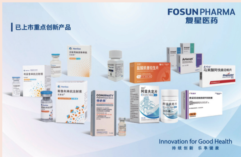
复星医药已上市重点创新产品

二是加速开发自研及许可引进创新产品。汉斯状完成美国首例患者给药，汉曲优有望成为首个在中国、欧盟、美国获批的国产生物类似药，13价肺炎球菌结合疫苗中国境内III期临床试验2023年4月完成入组，FCN-159用于治疗组织细胞肿瘤被国药监纳入突破性治疗药物程序；许可引进创新药FS-1502用于治疗HER2阳性不可手术切除的局部晚期或转移性乳腺癌于中国境内启动III期临床研究；HLX208用于治疗BRAF V600E突变的成人朗格汉斯细胞组织细胞增生症（LCH）和Erdheim-Chester病（ECD）4月