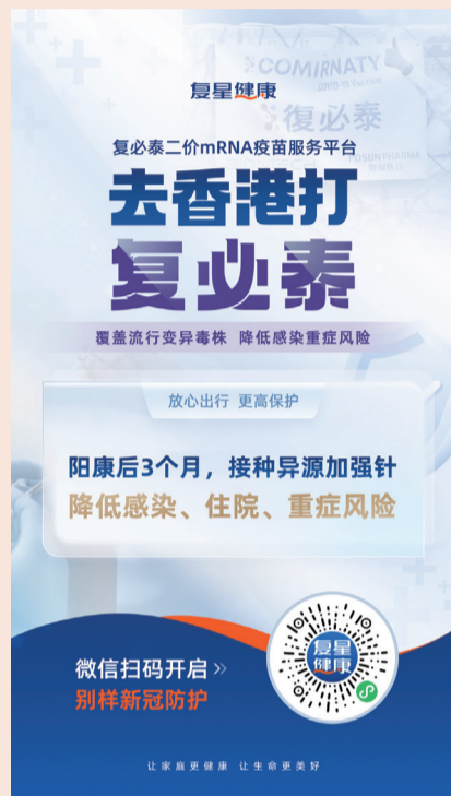
扫码预约赴港接种复必泰二价 mRNA 疫苗

三是我国内地大多数人是2022年12月至2023年元旦期间感染新冠病毒。三个月过去后，抗体水平显著下降，不足以预防再次抵御未来疫情高峰。