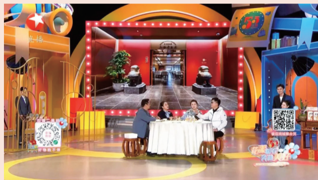
4月29日东方卫视情景剧云集19个复星旗下品牌呈现复星一站式家庭消费理念

合缘相识相恋，两家人相约上海老饭店商讨婚事，两位妈妈不约而同穿上Lanvin出席。为缓解撞衫尴尬，两家人以童涵春堂野山参、WEI蔚蓝之美明朝限定款精华水作为礼物互赠。席间复星旗下上海德兴馆的八宝辣酱、绿波廊的手剥虾仁、宁波汤团店的芝麻汤圆，松鹤楼的苏式焖肉面……这些熟悉的上海味道麻溜“报菜名”，让观众体验了一把“云吃席”。双方父母送给小两口的“老庙有鹤”系列首饰、《大闹天宫》联名限量款上海表，以对传统品牌形象的突破、新鲜元素的注入，迅速俘获两位年轻人的心。最终主人公走向幸福的婚姻，准备前往三亚特兰蒂斯酒店度蜜月，同时让复星联合健康险为小家保驾护航。通过一出短短的情景剧，展现了复星作为一家创新驱动的全球家庭消费产业集团，满足两个家庭丰富却不尽相同的需求，令“星式生活”的美好一览无余。