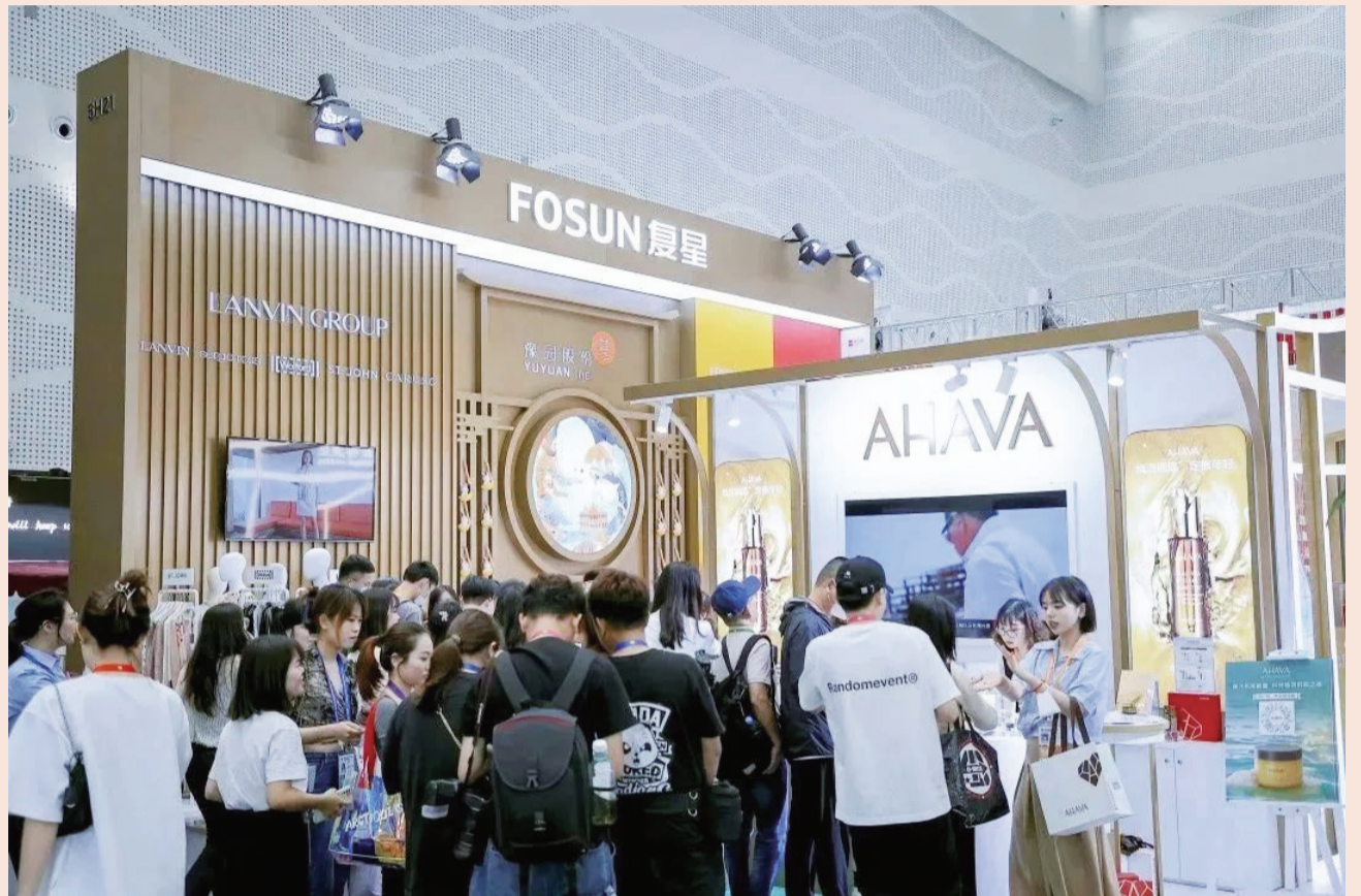
复星连续三年参展消博会。本届消博会吸引了来自60多个国家和地区的3100余个知名品牌参展

覆盖家庭消费多个领域的高品质培育彩钻品牌LUSANT露璨、国表领先品牌海鸥表、中华国药老字号童涵春堂、豫园制造