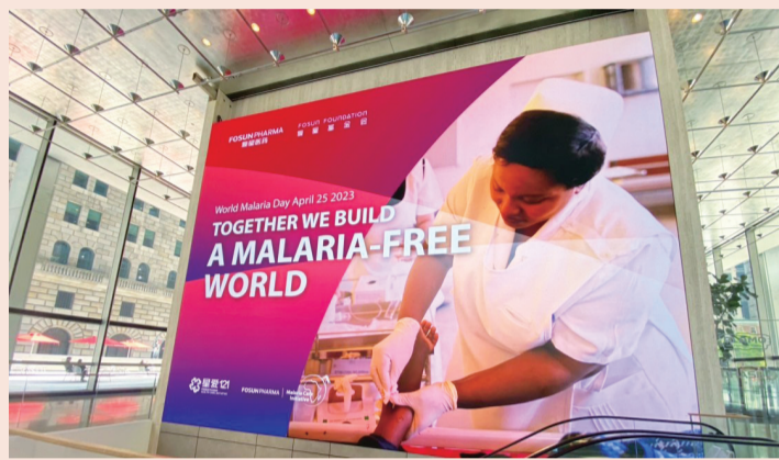
复星点亮全球产业地标大屏支持“共建无疟疾世界” 图为复星地处美国纽约的28 Liberty

一场全球范围内的公益奔跑更早起步。4月20日起，从抗疟创新药青蒿琥酯的发源地——广西桂林，到黄浦江边、西子