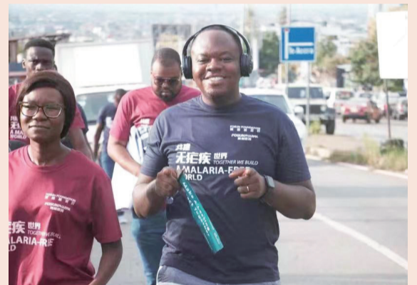
公益跑“延伸”至非洲