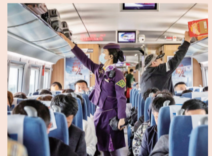
杭绍台铁路一季度客运量超 235 万人次