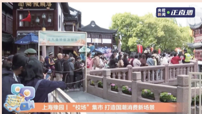
央视直播镜头下，九曲桥热闹非凡，老字号南翔馒头店排队长队，艺术游园充满趣味的豫园商城成为国潮消费新场景