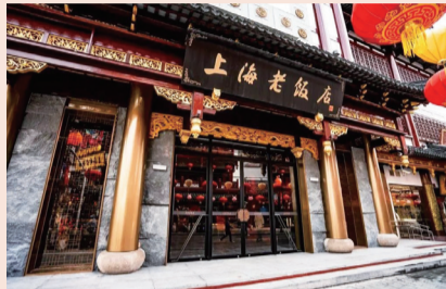
上海老饭店豫园店 2023 年 1 月 17 日全面升级形象、菜品、服务后，单月销售额连创佳绩

4月28日，豫园股份一季度实现营收152.44亿元，同比增长22.61%，归属母公司净利润3.36亿元，同比增长3.61%，归属于上市公司股东的扣除非经常性损益的净利润2.73亿元，同比增长0.15%。其中，消费板块营收127.27亿元，同比增长19.02%，占比持续提升至83.49%，收入结构优化，其中珠宝时尚板块营收114.94亿元，同比增长28.55%，餐饮板块3.71亿元，同比增长71.03%，酒业板块舍得酒业20.21亿元，同比增长7.28%。豫园股份财务状况稳健健康，经营性现金流36.55亿元，同比增长299.91%。货币现金131.86亿元，较2022年底增加23.41亿元，资产负债表健康程度提升。豫园股份一要把握市场复苏机遇，以东方生活美学引领消费升级。客流和销售额双双佳绩，客流同比提升87%，1月绿波廊营收1038万元，创历史单月新高。二是加强科创、研发、原创能力的“产业大脑”构建。老庙古韵金销售额超30亿元（含税），同比增长72.47%。“愈感”旗下主打产品舒敏修红喷雾获2023 ICIC AWARDS 科技创新抗敏产品奖。2023年初真裳家预制面4.0版诞生。酒业全球科创研究院试运营。三是加速拓宽国内网点，同步启航全球战略。珠宝时尚一季度净增门店109家，总计4701家，商场店占比提升。日本北海道滑雪度假村“星野TOMAMU”一季度营收2.96亿元，同比增长116.97%。今年2月，豫园股份再购入日本另一优质滑雪场项目Kiroro，坐拥日本北