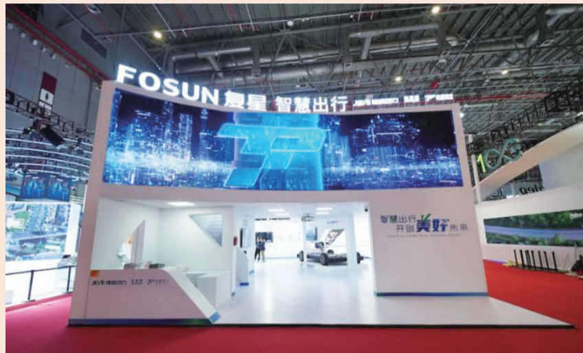
复星以“智慧出行”首次亮相车展

市场占有率上，国内与奇瑞、合众、长城、东风等量产客户保持3年以上稳定供货，新增上汽、江铃新能源、大运汽车等配套量产，完成舟之航、悠跑等定点。商用车新增吉利项目。2022年6月获传统欧洲车企定点、7月获日系车企巨头定点。2022年开