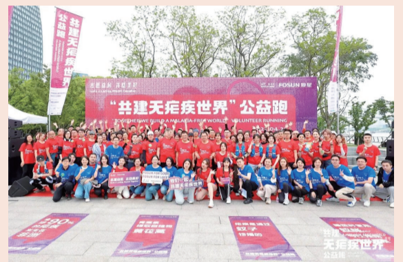
4月21日上海徐汇滨江“共建无疟疾世界”公益跑