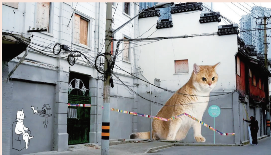
TANGO将“猫主子”绘制上墙

为营造浓厚艺术氛围，BFC串联全场艺术作品打造全新外滩游艺地图，为艺术爱好者们带来一站式打卡体验。以BFC广场为起点，由中国青年雕塑家冷冰创作的《聚气成形 元气万物》森林动物人先锋艺术展在此呈现。行至京都之家外广场，一只憨态可掬的熊猫横卧高台惹人注目，这件名为《涓》的艺术作品出自中国先锋艺术运动领军人物赵半狄之手，带来充满先锋、浪漫色彩的视觉享受。此外，BFC二层空降艺术家周轶伦作品《休闲长椅》，其作品从唾手可得的物件中汲取灵感，构建一个充斥着经