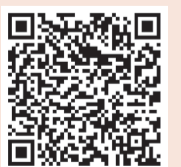
扫码助力 “无疟疾世界”

“在上海，为全球。作为一家植根中国的全球化企业，复星依托长期积累的创新与全球运营能力，积极投身公共卫生事业，持续开展公益行动。我们不仅把药品带到非洲，还要把在中国开展的乡村医生项目那样的基层经验带到非洲，秉持‘助天下’初心，让全球更多人享受到更健康、更快乐的生活”复星国际董事长郭广昌表示，未来，复星将携手抗疟专家及各方资源，持续助力非洲等疟疾高发地区消除疟疾，为实现“无疟疾世界”贡献“复星力量”。