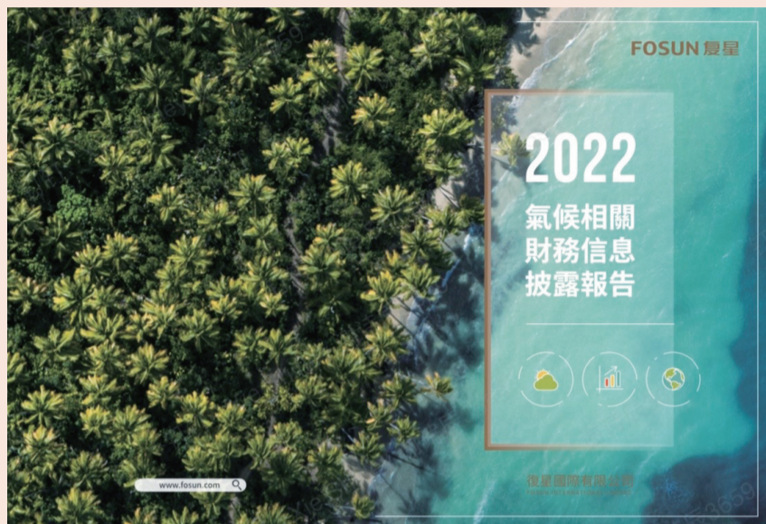
复星国际首份 TCFD 报告。详见文末链接

此外，为提升复星在绿色低碳市场的领导地位，集团注重对清洁技术的投资。目前，集团已投资多个清洁技术企业，涉及风能、太阳能、潮汐能、生物能等清洁能源行业，以及电池、前沿材料、储能、热电、智