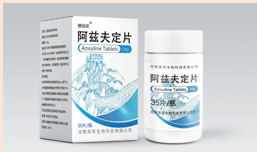
国产小分子抗新冠病毒药物阿兹夫定片

据中国疾控中心《全国新型冠状病毒感染疫情情况》显示，当前新冠病毒感染人数仍存在，每日保持在4000人以上。北京佑安医院感染综合科主任李侗曾教授近日在医学界采访中表示，“虽然我国第一波疫情高峰早已过去，但根据国外的疫情流行情况，我们认为新冠散发状态会持续很长时间，并且经过一定时间后，随着大家体内抗体水平下降和病毒不断变异，二次感染的人数也会不停增加，某些地区可能会出现小规模疫情。