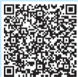
打开手机淘宝 扫一扫