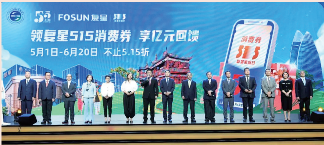
515复星家庭日携手支付宝发放亿元消费券