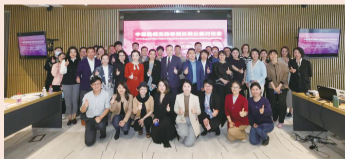
4月26日“中国民间支持非洲长效公益讨论会”现场