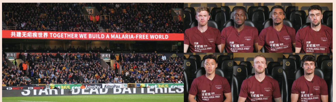
英国当地时间4月25日，英超赛场拉出“Together we build a malaria-free world”横幅

湖畔、香江两岸，再到美国、新加坡、美国、安哥拉、莫桑比克，海内外复星生态企业员工和公益伙伴身着“共建无疟疾世界”主题服装，陆续开启公益跑，为共创无疟疾世界鼓与呼。