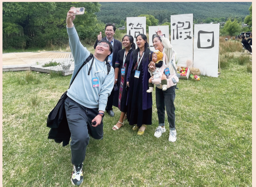
微纪实中的村医们被请到简单假日生活节现场

海拔2500米凉爽的风，拂过春日缕缕新芽。薄雾环绕玉龙雪山，天高云低衬托她秀美若神女。