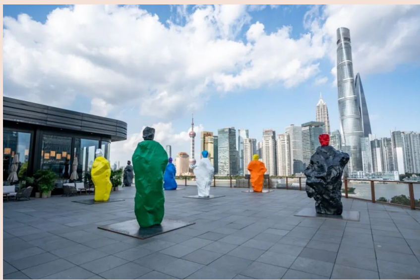
七尊高达三米的雕塑“修女+修士”，矗立于上海复星艺术中心露台

自梵语“तप्”（Tap），意为“发光；被火烧”，引申为“तपस्”（Tapas），意为“苦行”，即通过忍受痛苦求得解脱，是佛教中冥想和自律相结合的修行方式。但罗迪纳的影片并不流连于苦痛；相反，作品中搏动着热忱的欢庆。