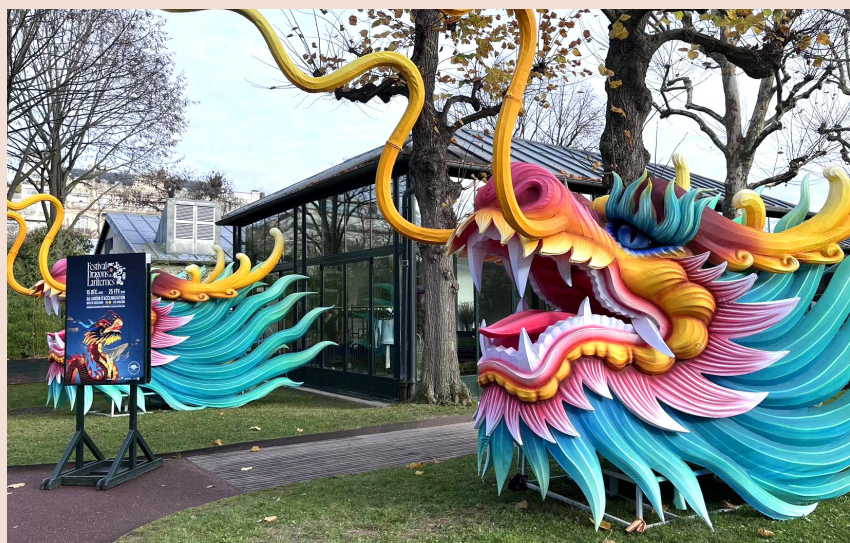
法国豫园灯会灯组陆续在巴黎风情园组装搭建

多亮点。2024年的生肖——龙，是本届法国豫园灯会主角。入口处的“双龙戏珠”门楼、妆点在街巷两侧的盘龙柱、有着美好寓意的“鱼跃龙门”灯组……龙的元素贯穿在整场灯会中。