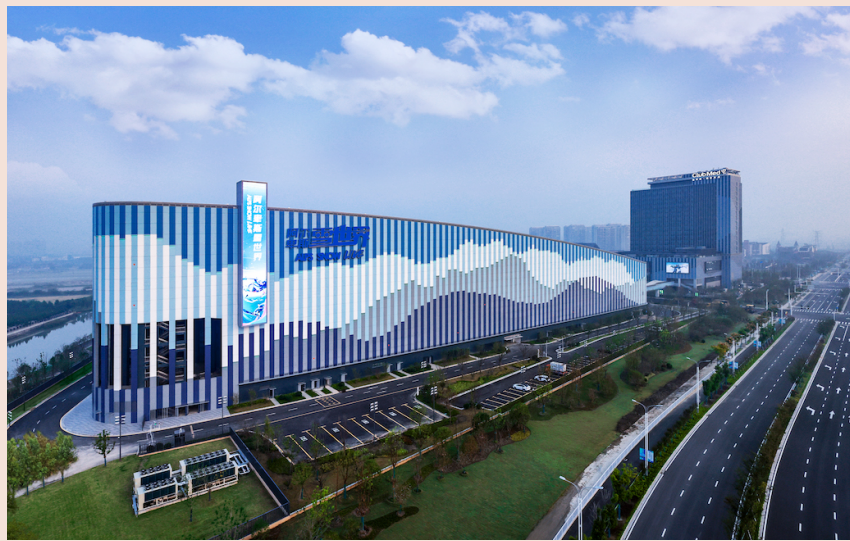
太仓阿尔卑斯国际度假区

在文旅领域，11月8日，由复星旅文历时5年打造的太仓阿尔卑斯国际度假区盛大开业。度假区坐落于苏州太仓市，毗邻太仓南站与上海嘉定区，距离上海城区仅