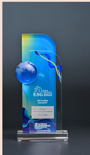
《彭博商业周刊/中文版》ESG领先企业大奖奖杯