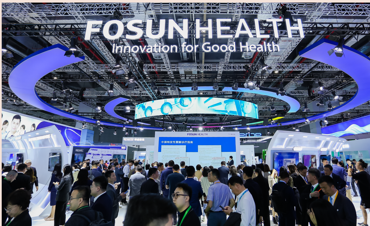
复星携众多新品首秀，连续六年参展进博会。Fosun Health展台前人头攒动

2017年，复星凯特引进了国内首个CAR-T细胞治疗产品奕凯达®（阿基仑赛注射液）。此后，通过连续参展进博会，让大众对这一前沿疗法有了深入了解。2023年6月，奕凯达®新增获批二线适应症，惠及更多一线免疫化疗无效或复发患者，成为目前国内唯一治疗该适应症的CAR-T产品，这也意味着奕凯达®将帮助更多的淋巴瘤患者获得治愈希望。