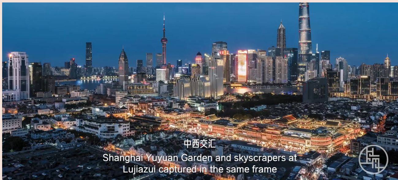
中西交汇 Shanghai Yuyuan Garden and skyscrapers at Lujiazui captured in the same frame