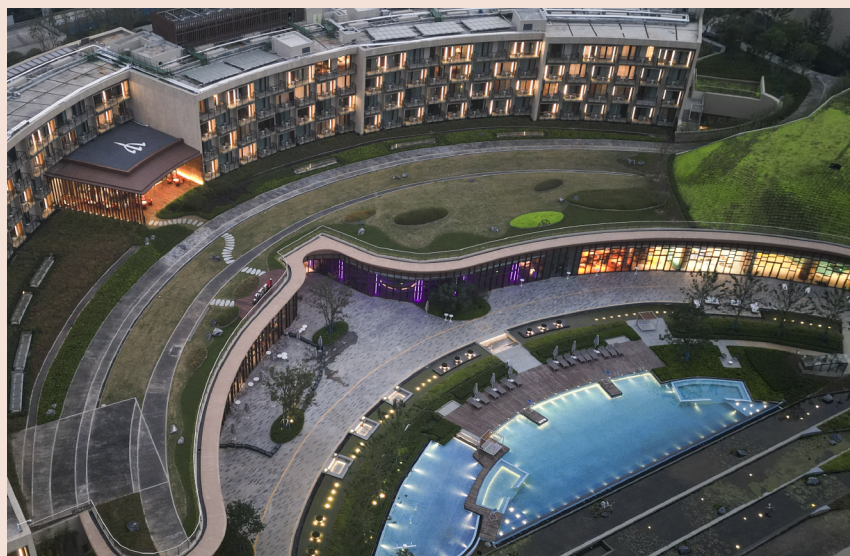
地中海白日方舟·南京仙林度假村