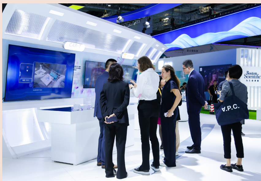
进博展台上，复星医药还带来了3大核心肿瘤支持治疗产品苏可欣®、复可舒®、奥康泽®

在肿瘤治疗支持领域，复星医药始终走在行业前沿。2021年，复星医药引入的创新药奥康泽®（奈妥匹坦帕洛诺司琼胶囊），是全球首个且迄今唯一同时阻断NK-1受体和5-HT3受体的双通道固定