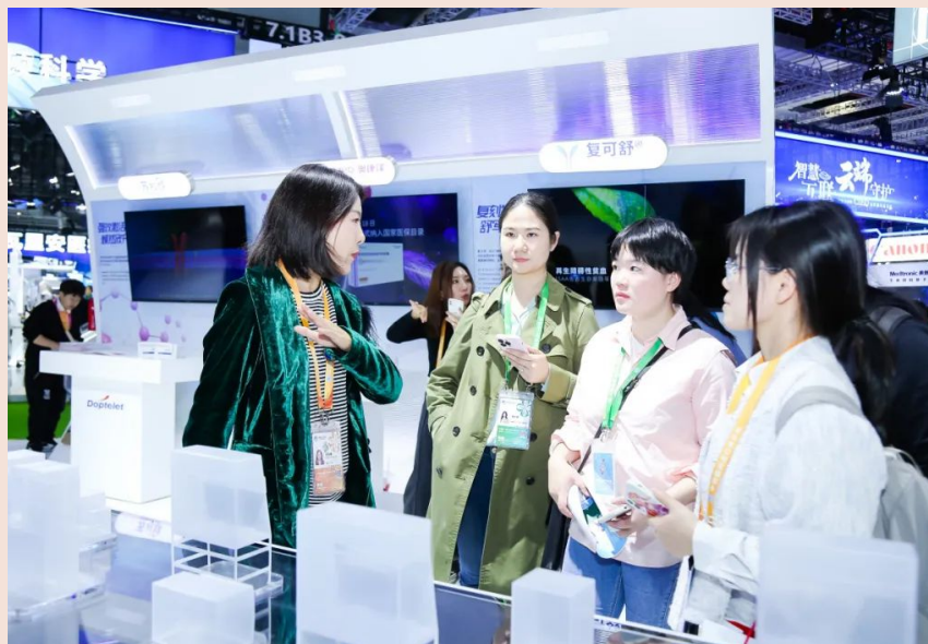
CAR-T见证了进博会成为全球知名企业共享中国发展机遇的重要平台

2018年，复星凯特参展首届进博会时，CAR-T细胞免疫治疗技术一经亮相就引发了广泛关注，不少参展嘉宾认为复星凯特或将给中国淋巴瘤患者带来治愈的希望；2021年，获批上市的奕凯达®成功开启了中国CAR-T治疗元年，并在第四届进博会上展示了其卓越的真实世界疗效，有力回应了社会各界尤其是广大中国淋巴瘤患者对于疾病治愈的殷切期盼。