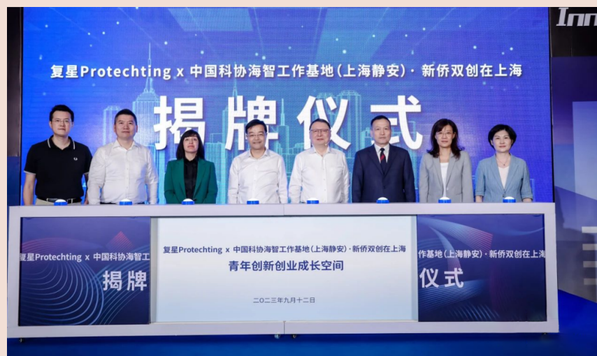
Protechting x 中国科协海智工作基地(上海静安)·新侨双创在上海揭牌仪式

2023年,Protechting也在继续扩大“朋友圈”。复星基金会携手上海市静安区科学技术协会、静安区归国华侨联合会等部门,落地“Protechting x 中国科协海智工作基地(上海静安)·新侨双创在上海”青年创新创业成长空间,链接科创资源,推进科技创新。这是为了构建全球青创孵化器,促进Protechting项目在上海落地的重大举措。