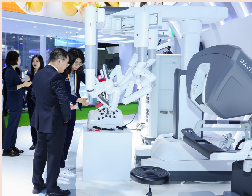
国产达芬奇Xi系统亮相第六届进博会

1小时车程，以阿尔卑斯为主题，融合冰雪运动、休闲、餐饮、购物、营地、艺展等多元业态，打造纯正的阿尔卑斯冰雪度假体验。