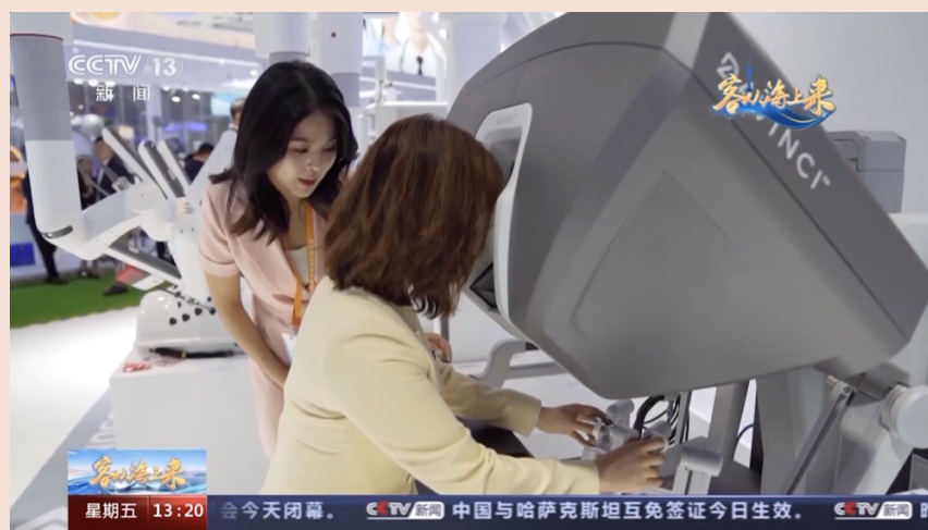
央视新闻以《达芬奇手术机器人的“变形记”》为题，播发特别报道。记者：唐蕾

今年是达芬奇手术机器人连续第六年亮相进博会。在2018年举办的首届进博会上，复星医药与美国直观医疗器械公司的合资公司直观复星带来的达芬奇手术机器人初次亮相，精准快速的“剪花蕊”操作演示科技感十足；从2019年的机械臂辅助导航支气管镜系统，到2020年的单臂手术平台——达芬奇SP手术系统……达芬奇手术机器人不断升级。