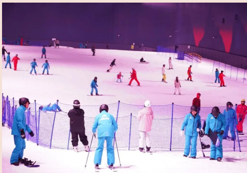
阿尔卑斯雪世界游客中既有来自太仓本地的市民，也有不少来自上海及周边长三角城市

的双重催化下，国内消费者对于优质的冰雪度假产品有着必然的需求，此外已有政策对文旅市场发布指引文件。由文旅部、发改委、国家体育总局共同印发的《冰雪旅游发展行动计划（2021—2023年）》提出，要扩大冰雪旅游优质产品供给，引导各地加大冰雪旅游设施建设力度，提升产品服务水平，推动建设健身休闲、竞赛表演、运动培训、文化体验一体化的滑雪旅游度假地。