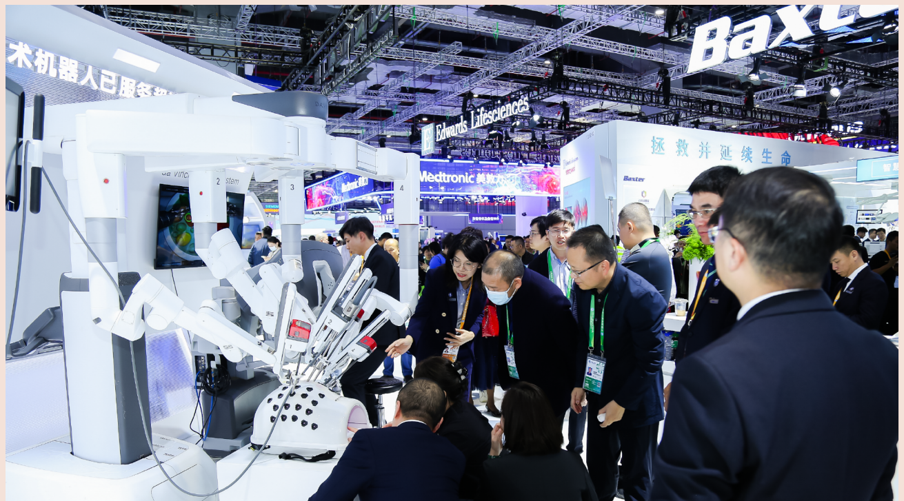
国产达芬奇Xi手术机器人亮相第六届进博会

通过进博平台，直观复星实现了明星展品到优质商品的转变：首先，进口达芬奇Xi手术机器人作为展品亮相第一届进博会。进博首秀后，达芬奇Xi手术机器人在中国上市，实现“进口展品”到“进口商品”的转变。今年，直观复星胸腹腔内窥镜手术控制系统（国产达芬奇Xi手术机器人）通过国药监批准，达芬奇Xi手术机器人国产化，成为国产“商品”。其次，Ion支气管镜控制系统于2019年亮相进博会。2022年Ion通过国药监审评，进入医疗器械创新审批绿色通道。