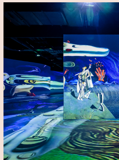
塞尚、达利沉浸式艺术展在阿尔卑斯光影世界开启

顶冰面带来的窒息般恐惧，在与小怪兽的雪球大战中放飞自我，在神秘莫测的罗刹雪国冥想打坐。同时，AI技术再次大显身手，将由观众涂色、栩栩如生的萌宠动物跃然屏上。四个冰雪主题的沉浸式互动空间，为全年龄段观众提供独一无二的感官盛宴。