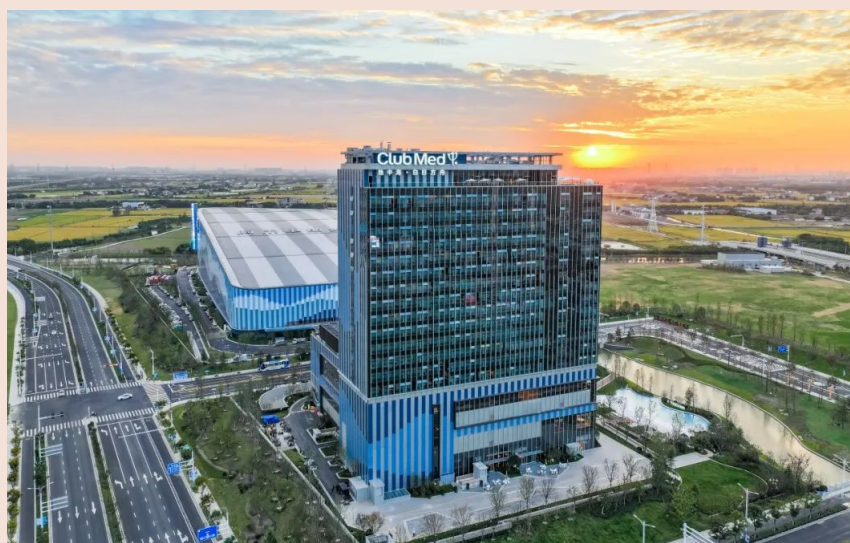
太仓阿尔卑斯国际度假区引入了源自法国、创立至今已有70多年历史的休闲度假品牌Club Med地中海俱乐部，地中海白日方舟·太仓度假村在设计上以“雪山游历之旅”为灵感